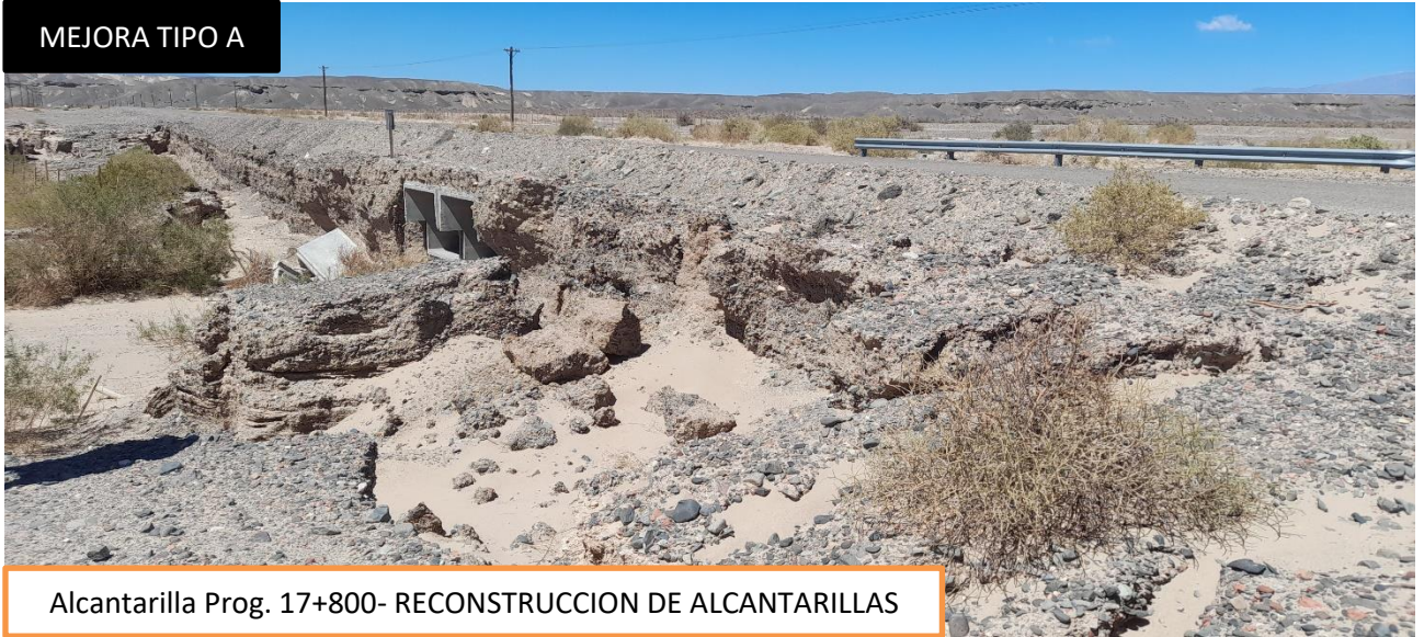
Alcantarilla Prog. 17+800- RECONSTRUCCION DE ALCANTARILLAS