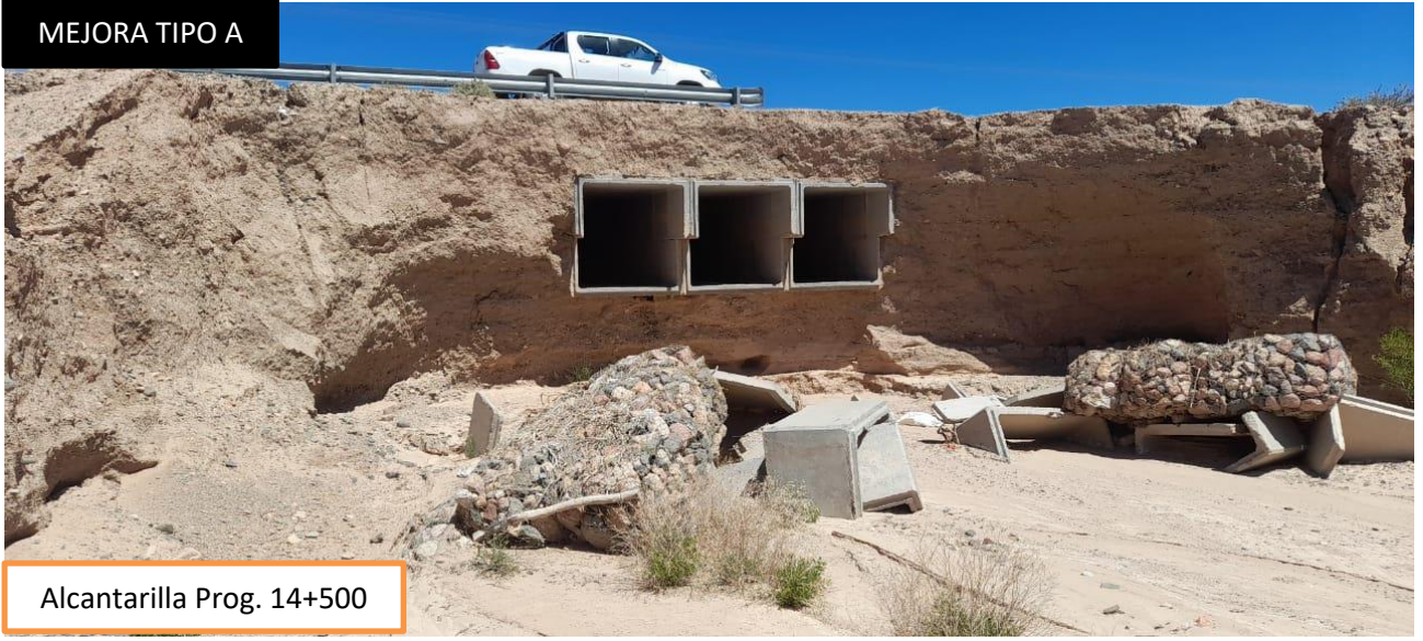
Alcantarilla Prog. 14+500