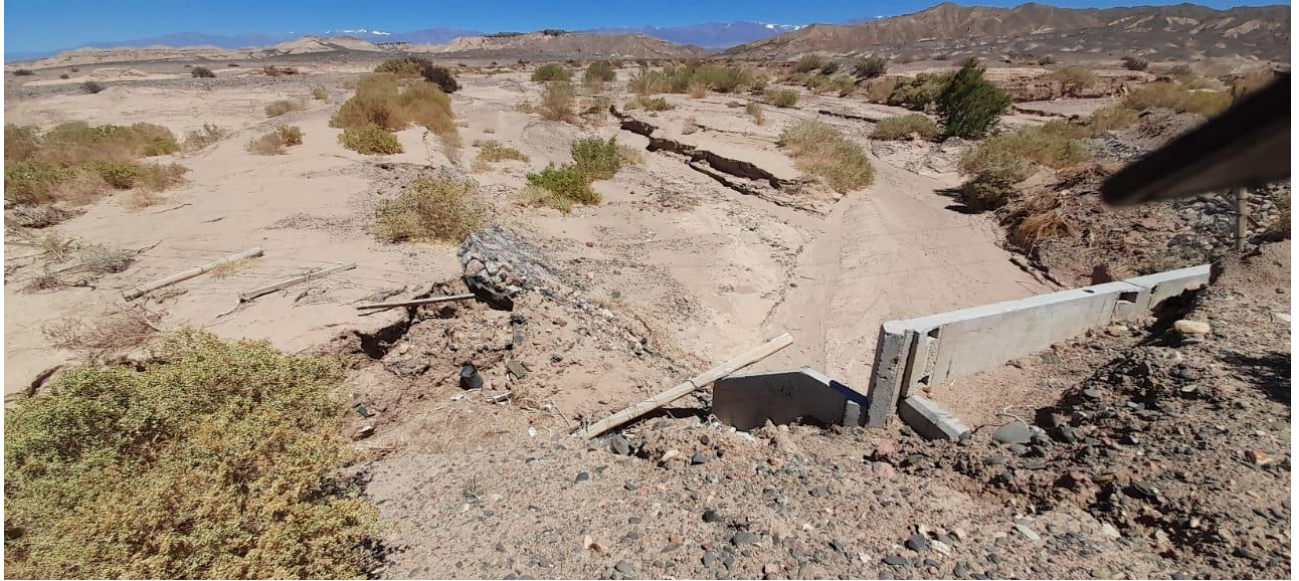
MEJORA TIPO B