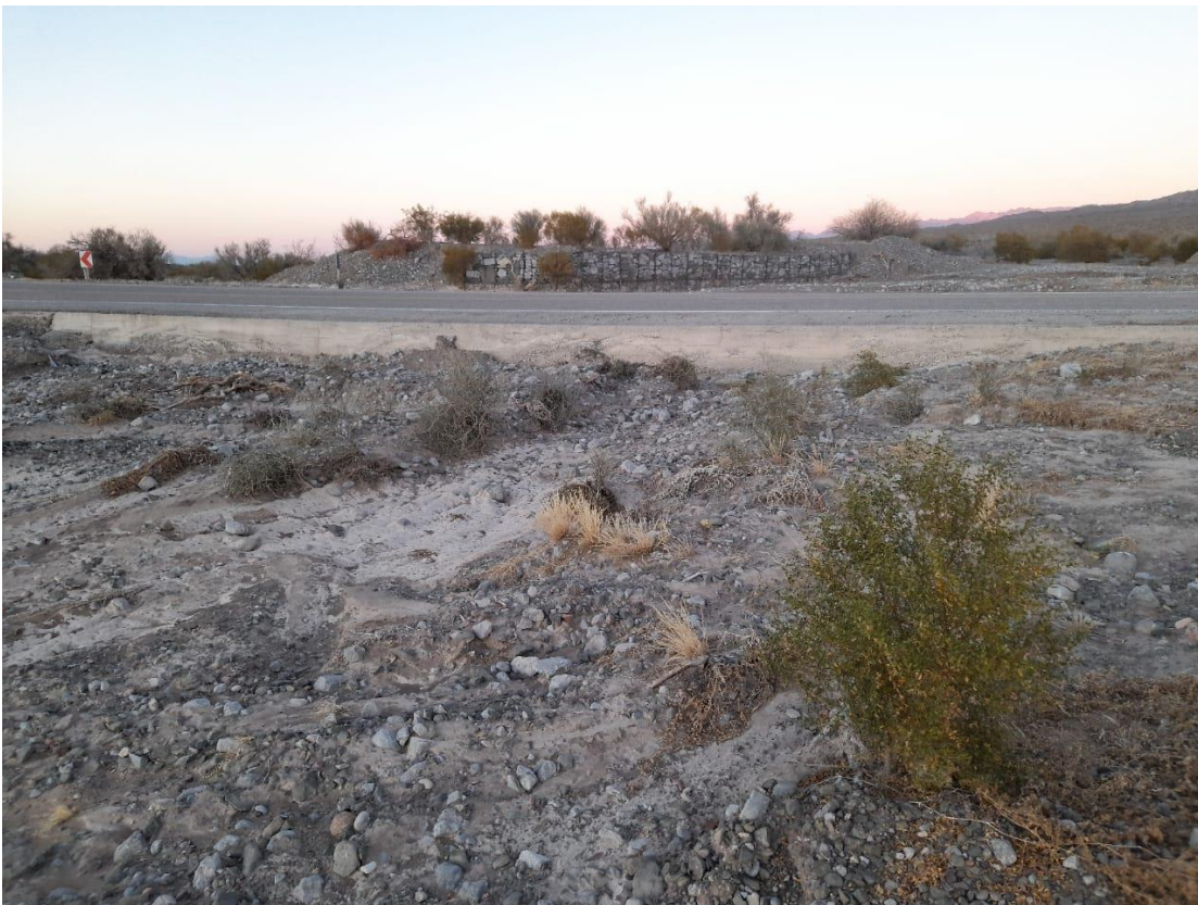
Foto: Otros badenes con intervenciones menores.