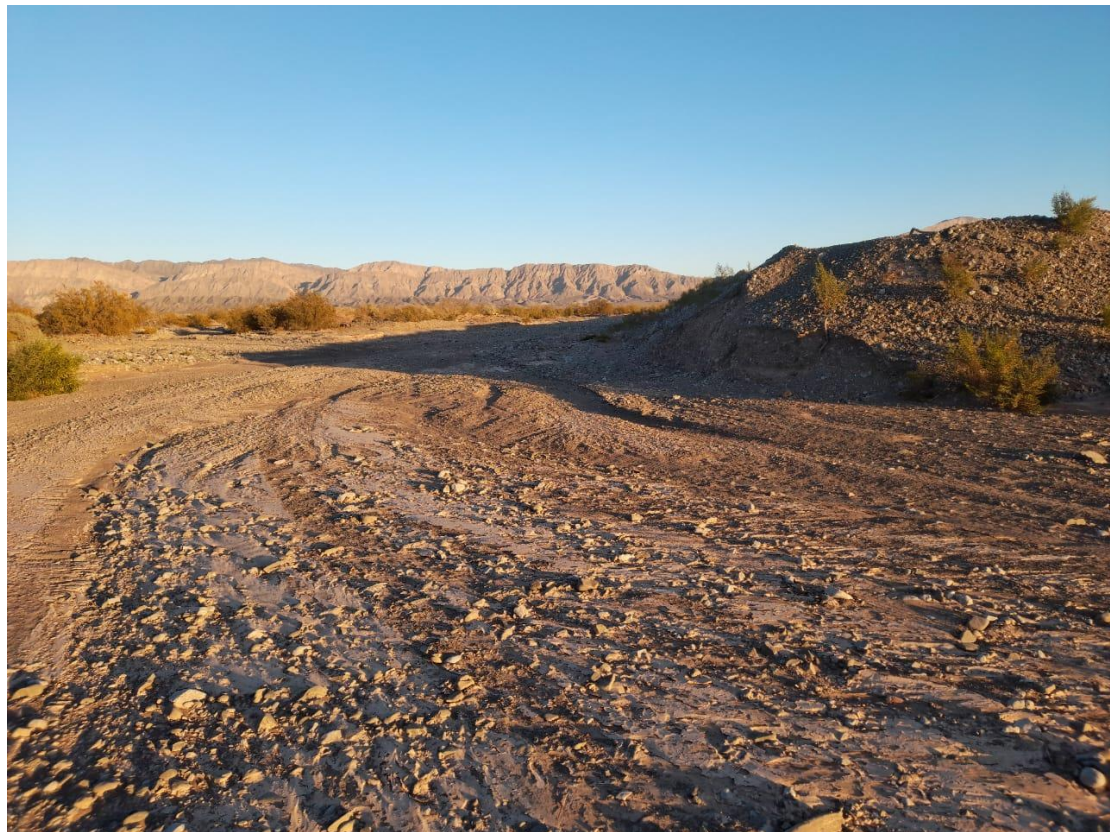
Foto: Badén N°4, Prog. 5+500, aguas abajo encauce y reconstitución de defensas varias.