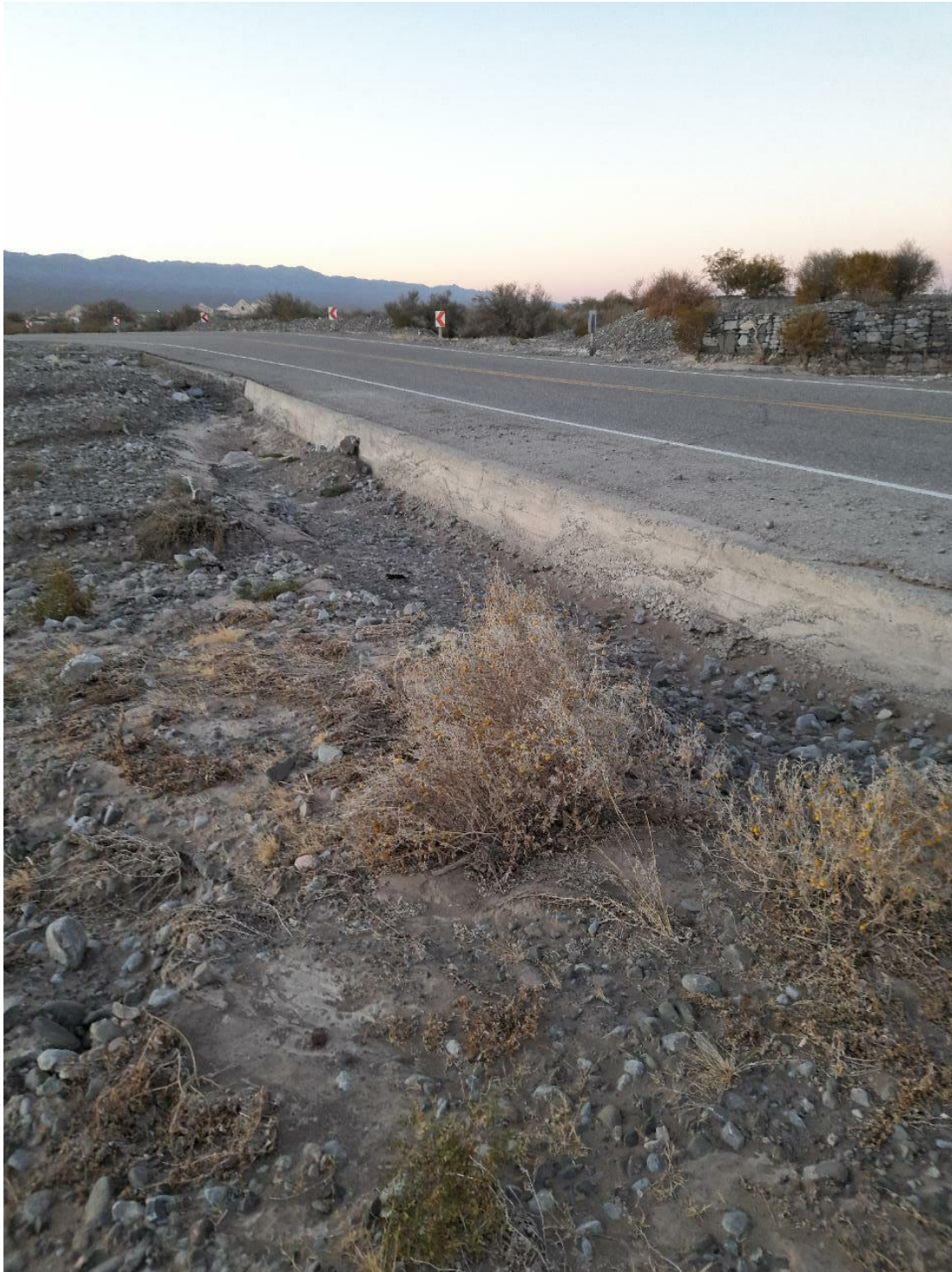
Foto: Otros badenes con intervenciones menores.