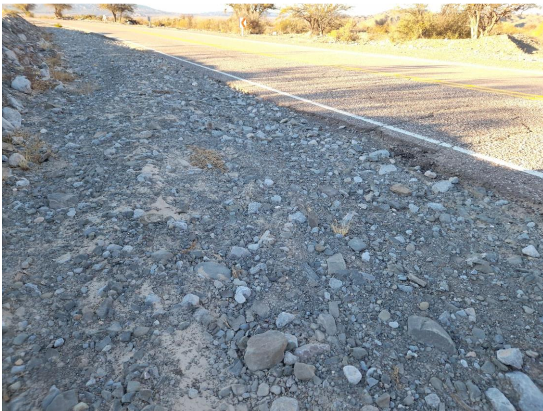
Foto: Estado general de banquetas.