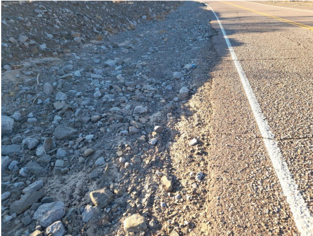
Foto: Estado general de banquetas.