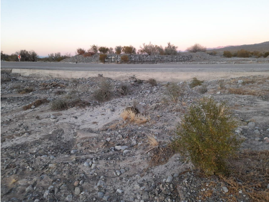
Otros badenes con intervenciones menores.