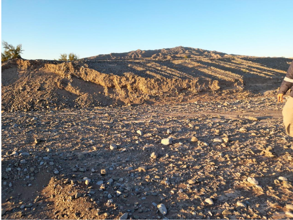
Foto: Badén N°4, Prog. 5+500., aguas arriba encauce y reconstitución de defensas.