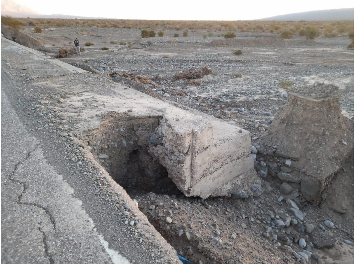
Foto: Badén N°2- Erosión en pie de badén y descalce de banquina y calzada.