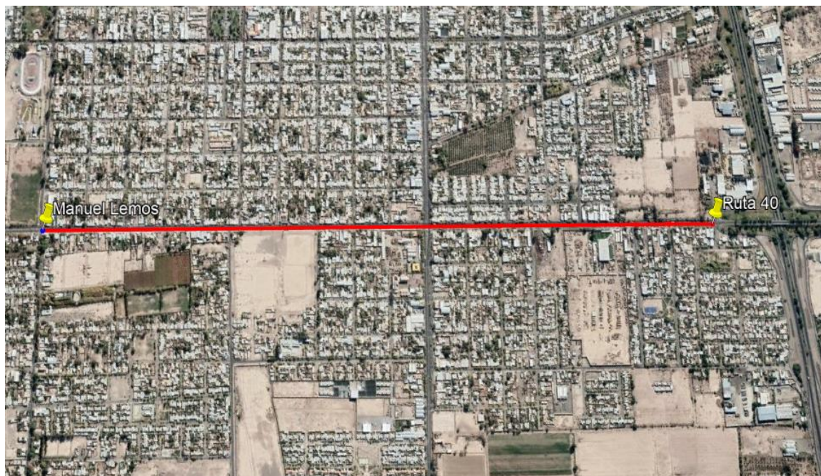
Figura 1: Croquis de ubicación. Calle Agustín Gómez entre Ruta 40 (acceso) y calle Manuel Lemos.

La obra se emplaza sobre Calle Agustín Gómez (Calle 5) comenzando en la intersección con Ruta 40 (acceso) hasta la intersección con calle Manuel Lemos. Departamento de Rawson / Pocito, Provincia de San Juan.