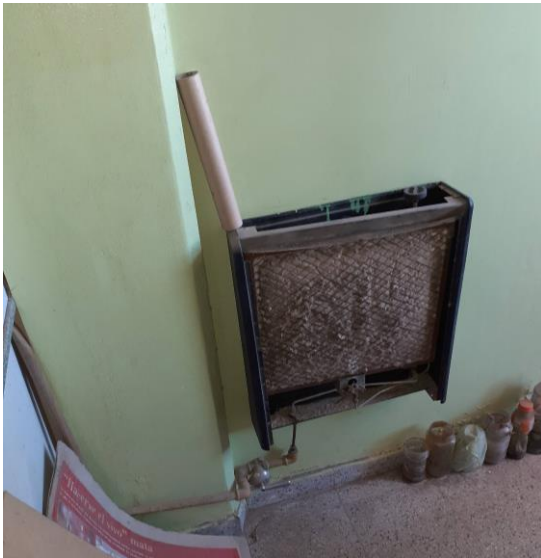
Reemplazar calefactor y llave de paso