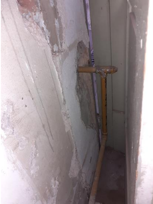
Colocar accesorios correctos