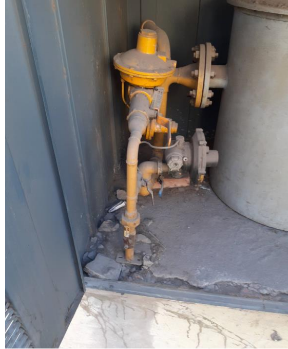
Reparar gabinete de medición y regulación