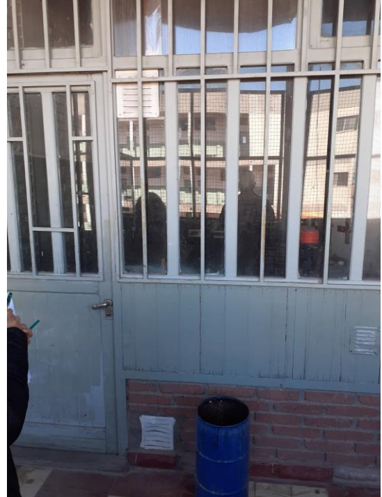
Cambiar rejillas de ventilación