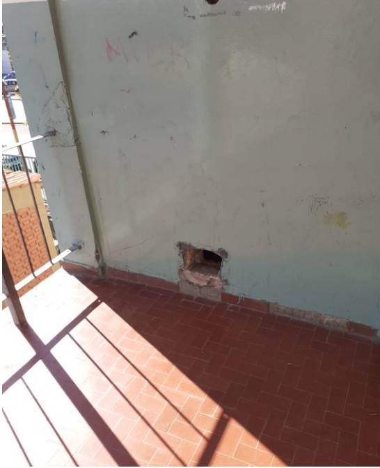
Desobstruir rejillas de ventilación