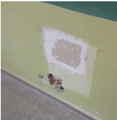
Colocar artefacto y llave de paso