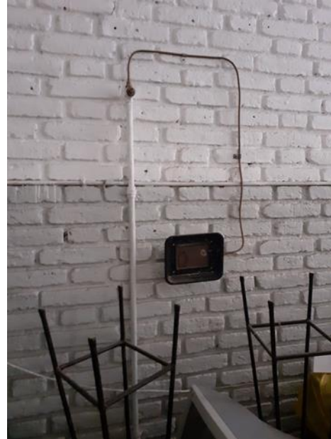
Realizar conexión reglamentaria