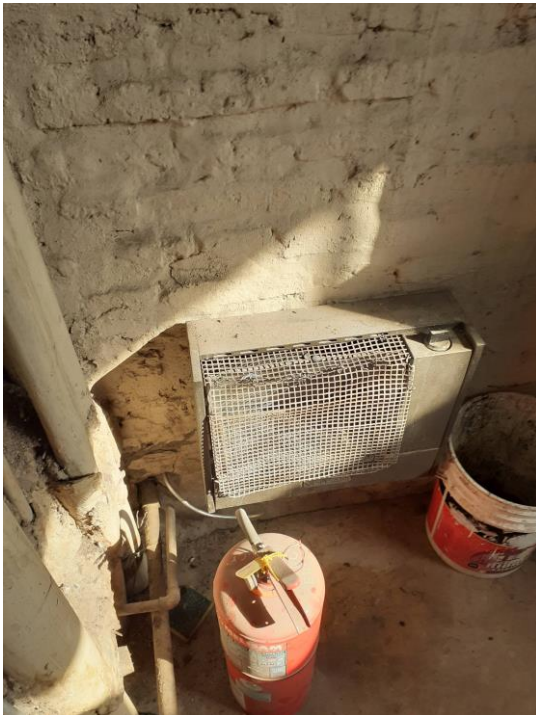
Anular conexión de calefactor