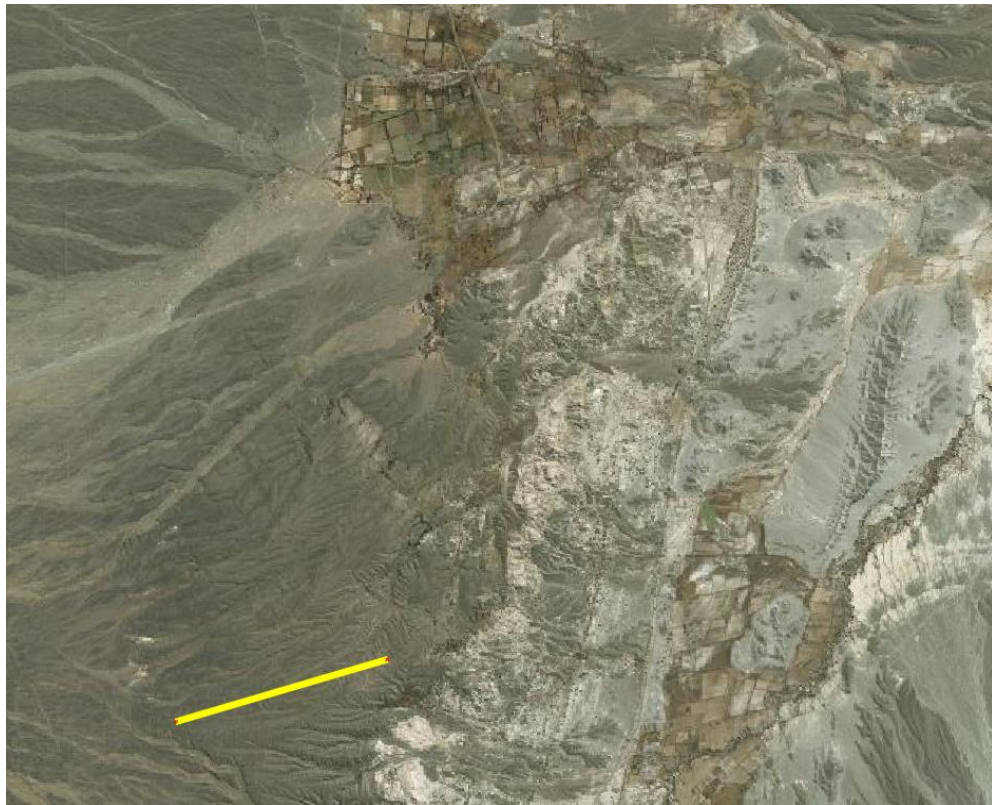
Ilustración 1 - PISTA IGLESIA