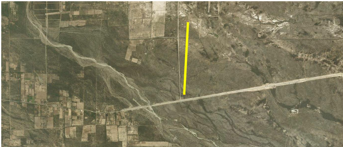
Ilustración 3 - PISTA VALLE FERTIL

Siempre dentro del ámbito de la provisión de los servicios de monitoreo con estaciones meteorológicas y presentación de los resultados de las mediciones, el alcance de los servicios ofertados en esta propuesta es el listado mostrado a continuación.