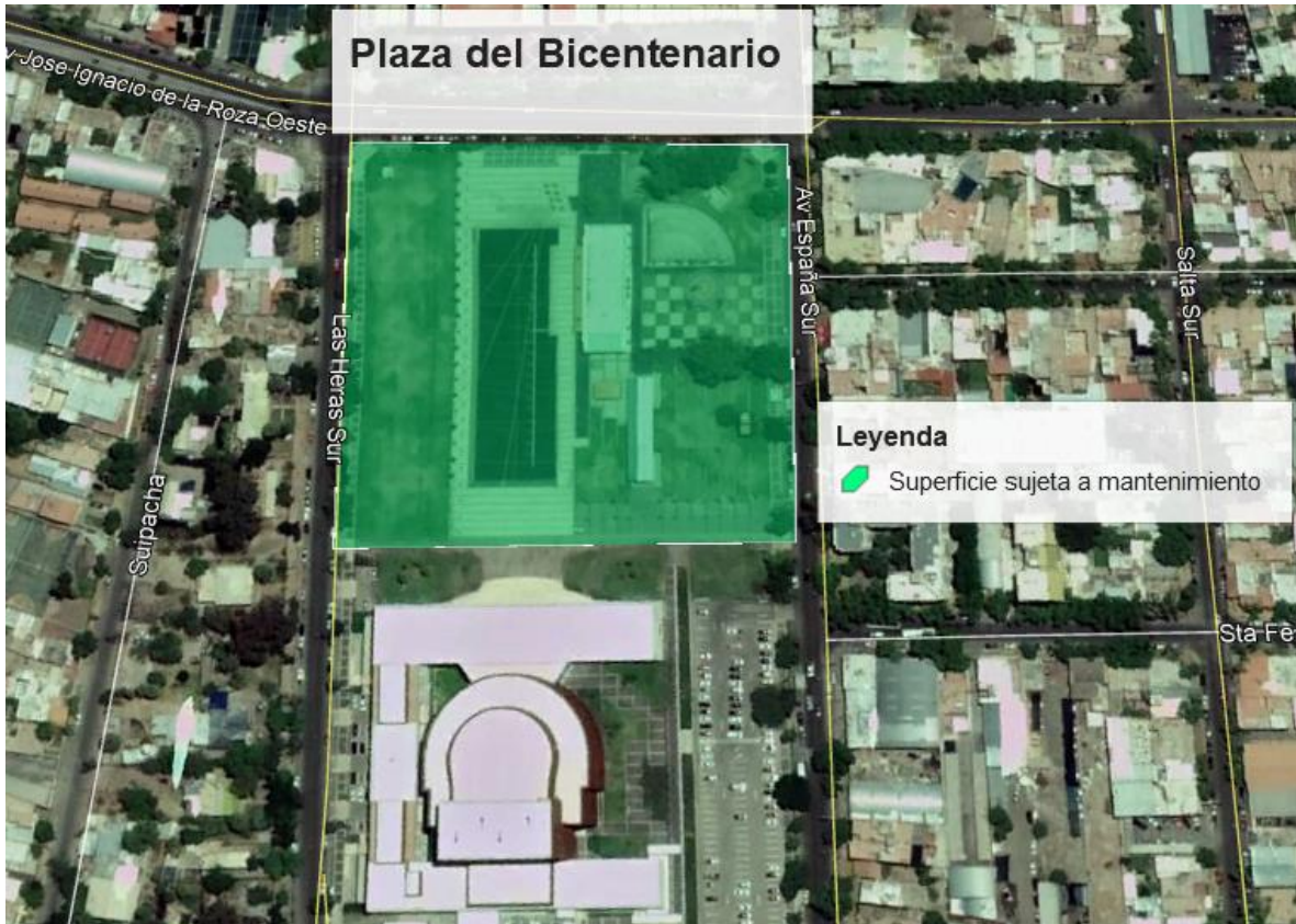
Figura 2: Plaza del Bicentenario