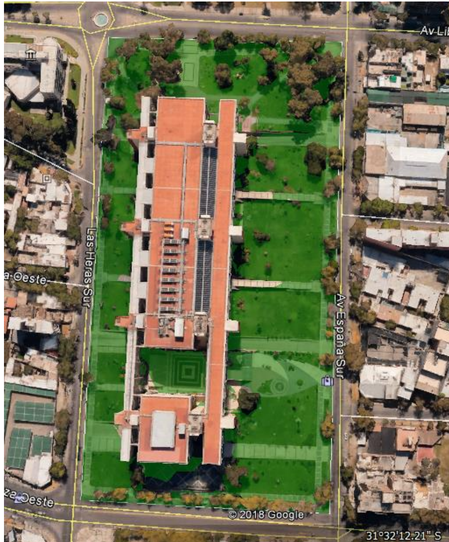
Figura Edificio Cívico