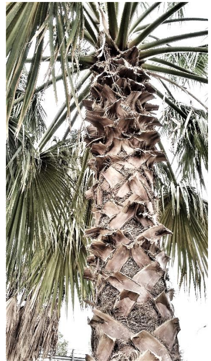
Fig. 6: Restos peciolares no uniformes.