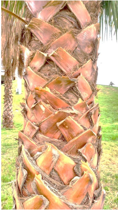
Fig. 2 Palmera de hoja palmada. Peciolo podados al ras. Aceptable