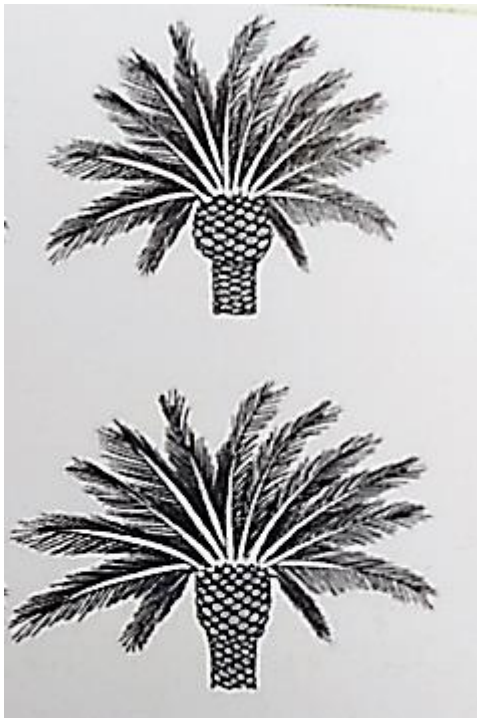
Fig.5: Croquis con ejemplos de collar o capitel de palmera.