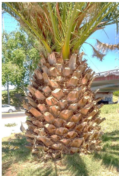
Fig. 3.2: Hoja alargada, excesivamente podada Peciolo demasiado largos.

Ejemplo de palmera mal podada: De la copa, normalmente esférica, se dejó solo el cuarto superior con el cogollo y hojas jóvenes. Se eliminaron las hojas adultas y las maduras, que debieron haberse conservado. Los peciolo de las hojas quedaron